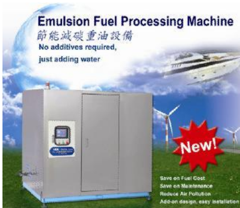
特種低硫燃料油實測結果